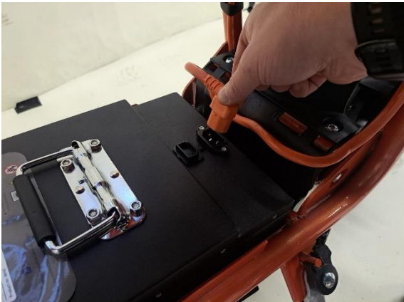
Irrota akun pistoke.