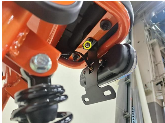
Irrota istuimen kiinnitysmutteri (kiintoavain 10 mm).