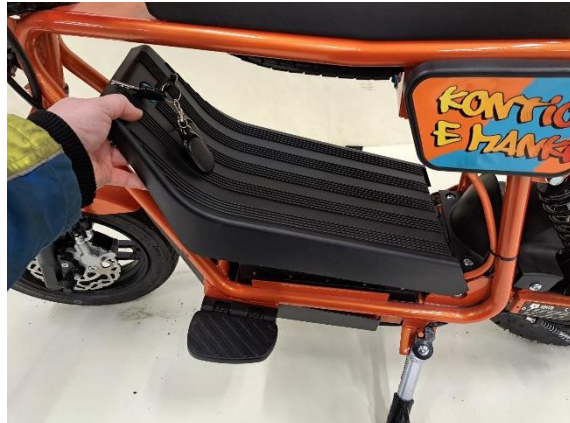
Ota akkukotelon kansi pois.